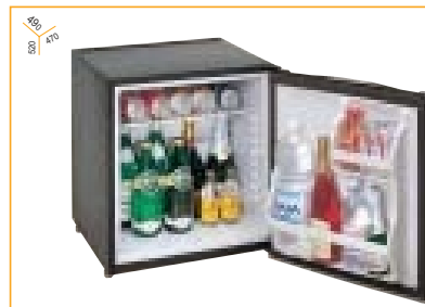
Tutti i modelli sono dotati di cerniera di traino Sliding hinge standard with the minibars