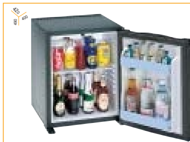
Gruppo refrigerante integrato nel mobile The cooling unit is integrated in the cabinet